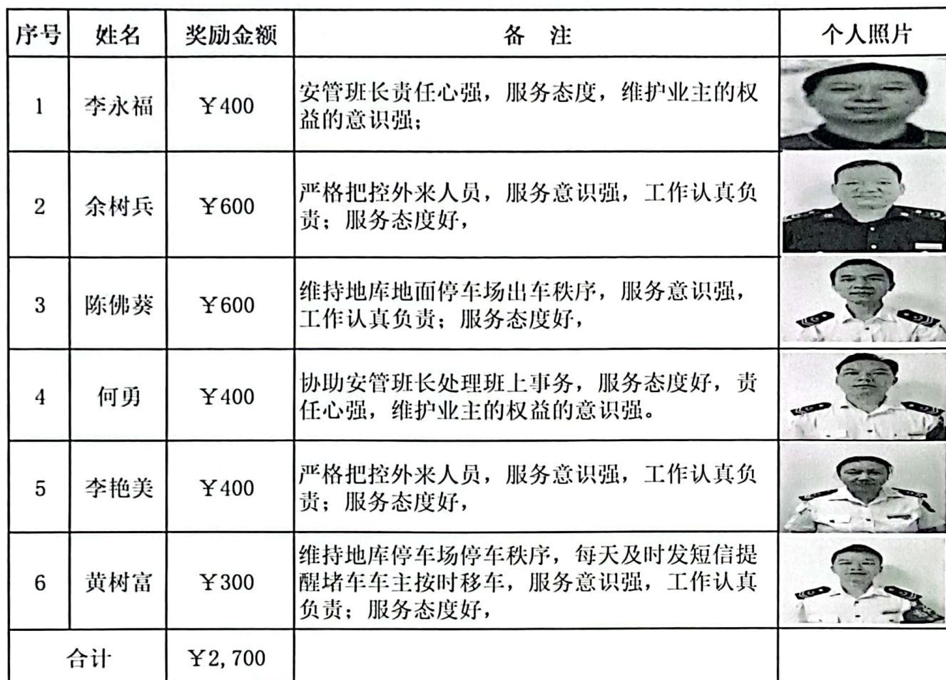
天然居2024年2月份门岗奖金发放明细表