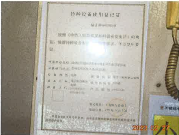
图 1：电梯使用登记证