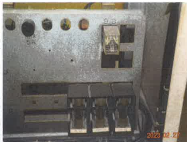
图 8：电气设备防护罩壳防护等级低于 IP2X