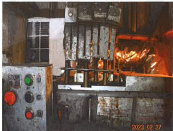
图 14：超载检测装置失效