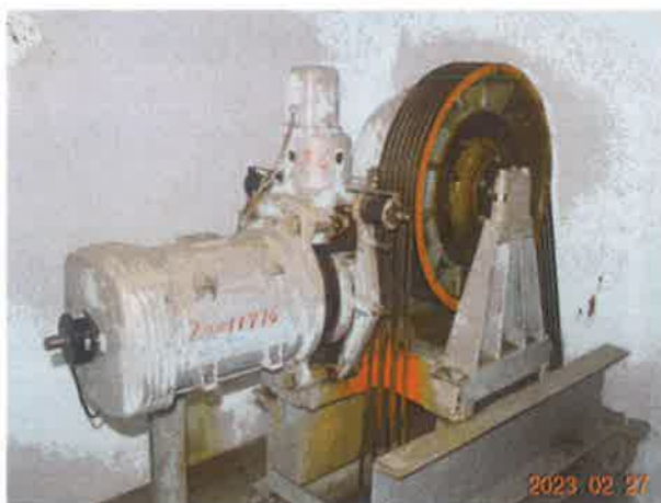
图 9：曳引轮未设置防止异物进入的防护装置