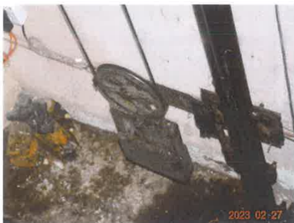
图 21：张紧轮旋转部件未设置防异物防护罩