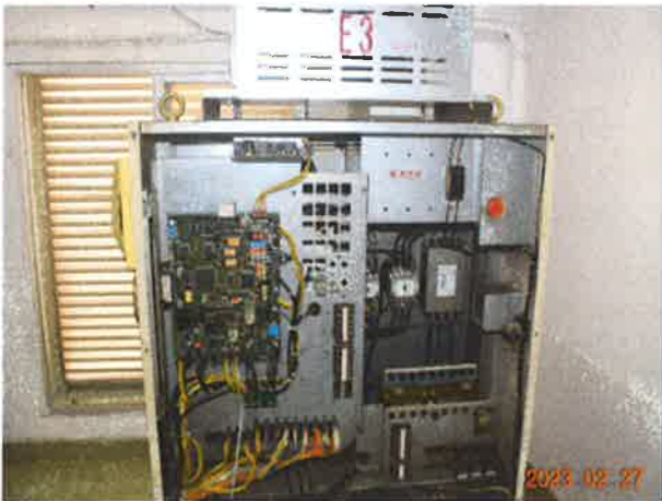
图 5：上海三菱电梯有限公司控制柜