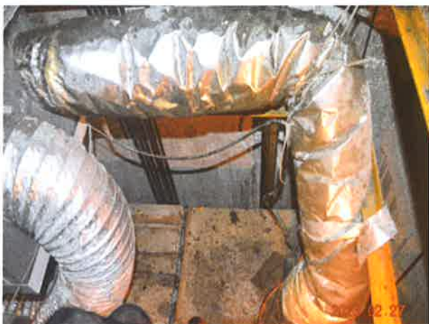
图 15：轿顶护栏设置不符合现行标准要求