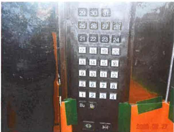
图 4：轿厢操作装置部分按钮存在动作不良