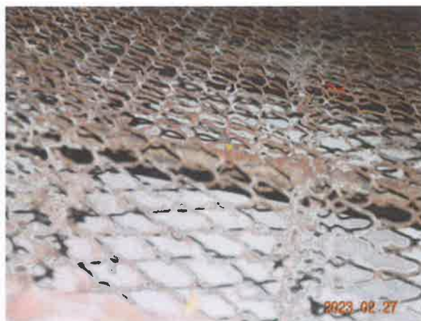
图 22：井道壁的护网设置不符合现行标准