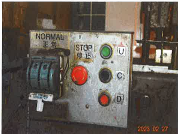
图 13：轿顶检修急停装置无防误操作保护