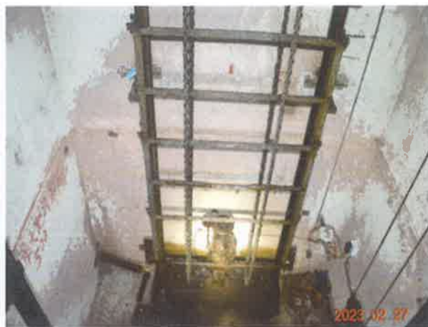
图 20：底坑对重运动区域防护不符合新规范