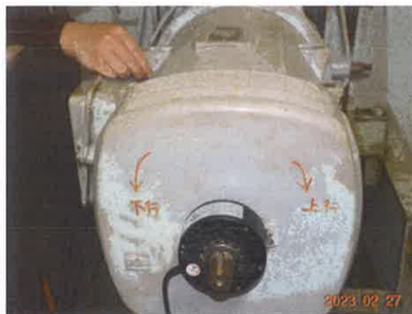
图 10：可拆卸盘车手轮未设置电气安全装置