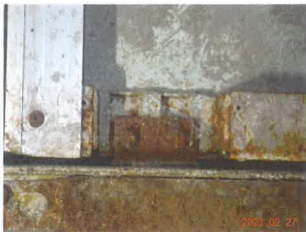
图 19：部分层门门滑块锈蚀磨损