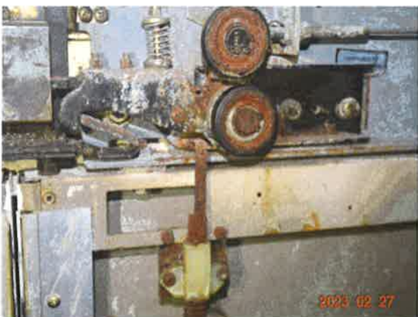
图 17：部分层门锁紧装置机械部件严重锈蚀