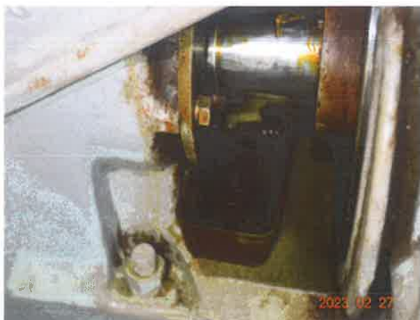
图 11：减速箱存在渗漏油现象