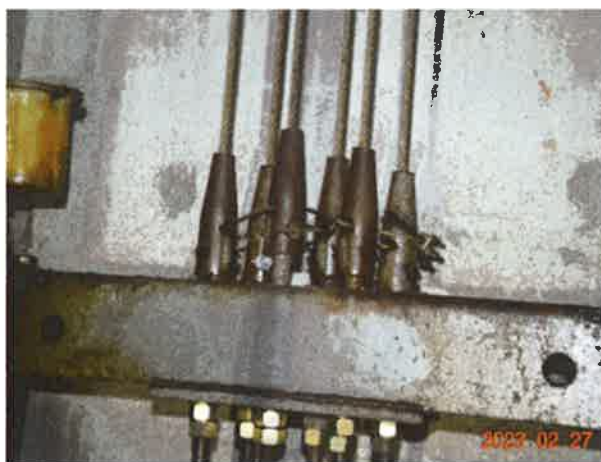
图 18：绳头组合无弹簧缓冲装置