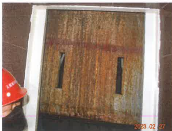
图 23：轿厢护脚板金属部件锈蚀