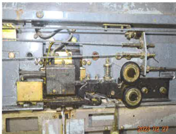
图 16：人为短接门锁电梯仍能再次启动