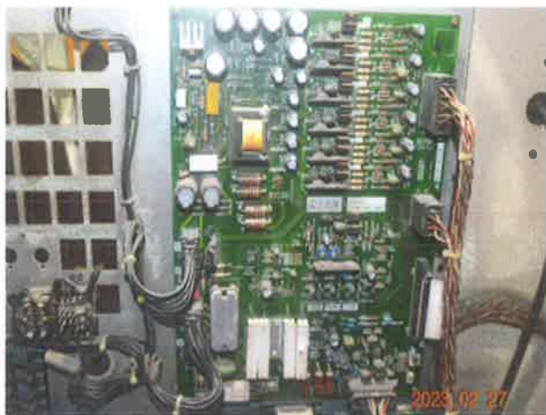
图 7：驱动装置变频器电子器件存在老化