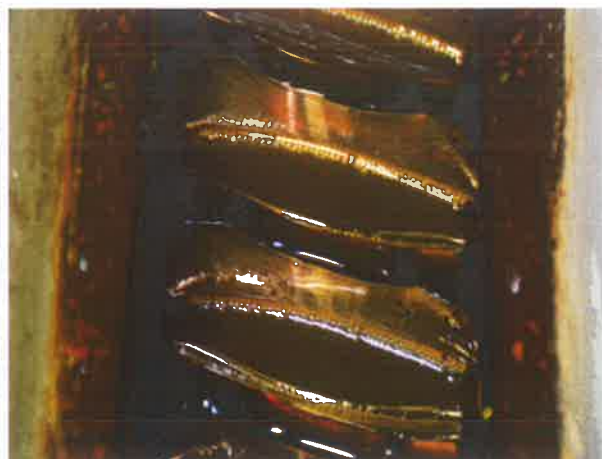
图 12：传动副齿面发现明显的啮合缺陷（点蚀）