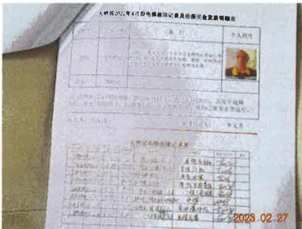
图 3：查阅电梯相关的安全技术档案