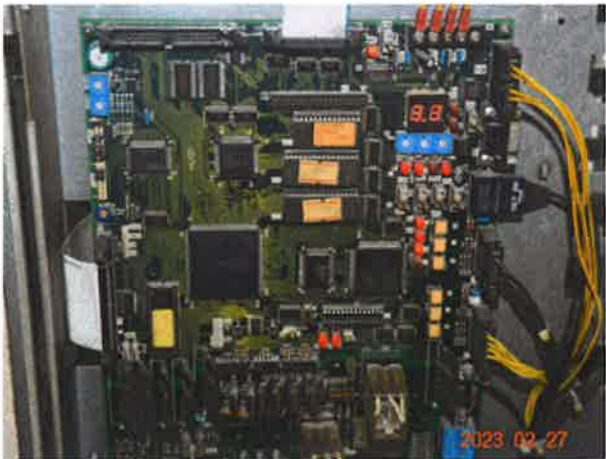
图 6：控制主板电子元器件存在老化