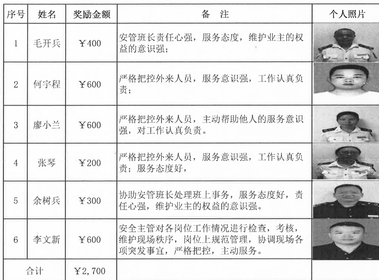
天然居2022年9月份门岗奖金发放明细表